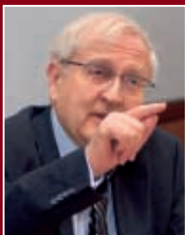
Rainer Brüderle Im Dialog mit dem BVMU-Kuratorium